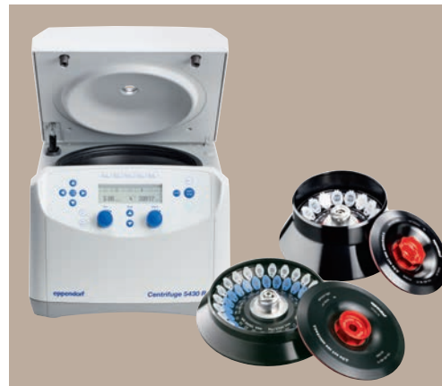
Одна центрифуга, два ротора: центрифуга с охлаждением 5430 R с ротором на 48 пробирок объёмом 1,5/2,0 мл и ротором на 16 пробирок объёмом 5,0 мл