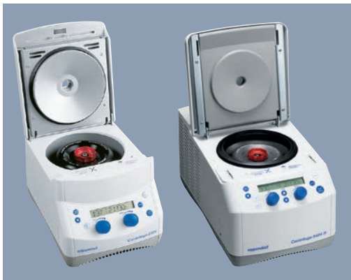
Новые комплекты центрифуг 5424 и 5424 R для молекулярно-биологических исследований, как со стандартным ротором, так и с ротором с увеличенным ободом Eppendorf Kit.